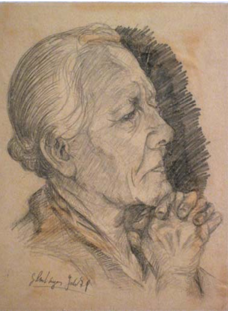
Bildnis einer alten Frau, 1979, 17 cm x 22 cm